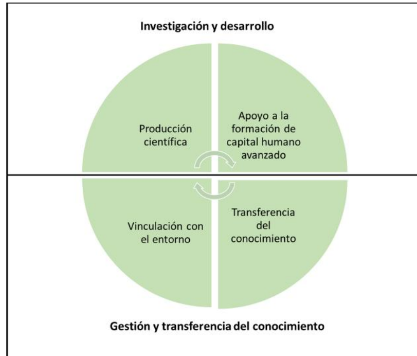
Figura 1. Representación de las cuatro áreas de trabajo de CEAZA.